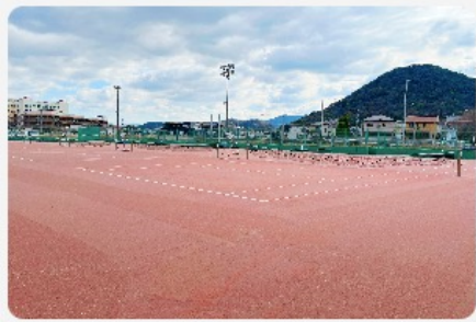
全天候型のガーネットクレーコート