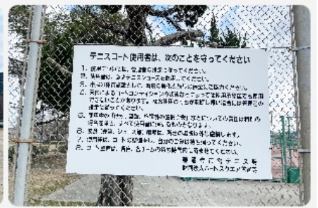
注意事項をご確認ください