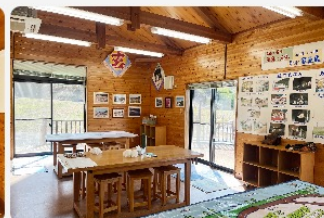
定期的にワークショップなどが開催されています