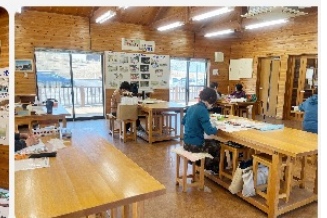
6つの大型机があります