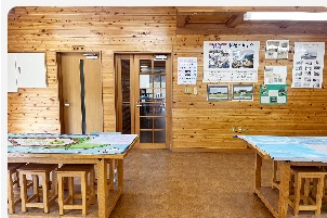
ロジック風の室内