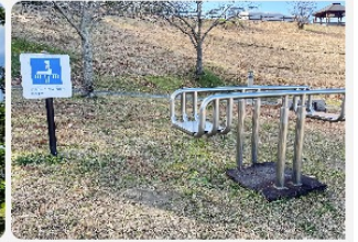
散策とストレッチが楽しめます