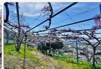
見頃の時期の藤棚