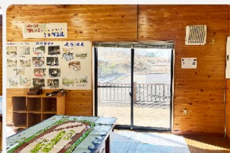
口気持の良い日差しが入ってきます