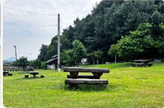
キャンプサイトとテーブル