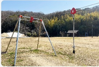
人気のスカイロープ

スカイロープ（ターザンロープ）といった人気の遊具の他に、大人の方でもストレッチが楽しめる上体ひねり・前屈ボード・アームローリングなど、たくさんの遊具があります。