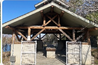
かまどと水道があります