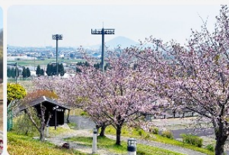
桜の時期は多くの来場者で賑わいます