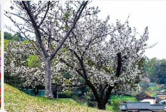
お花見シーズンもおすすめ