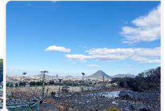
展望台からは飯野山が綺麗に見えます