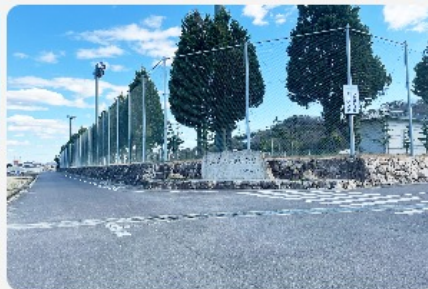
公園・グラウンド手前 にある石看板