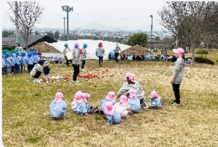
広い芝生公園は保育園の遠足にも使われてい ます