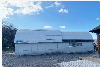
スライド開閉ドーム屋根を採用