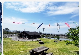
5月の連休に園内を泳ぐ、名物のこのぼり！