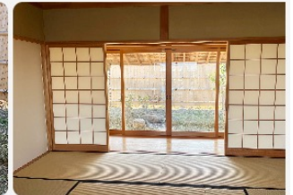
和室が2部屋あります