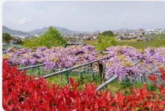
展望台から見える藤棚