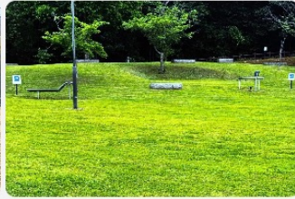
鮮やかな緑の芝（春～夏）