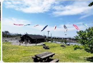
空を泳ぐ鯉のぼり（5月）