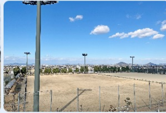
芝グラウンド（5～12月に貸し出し）