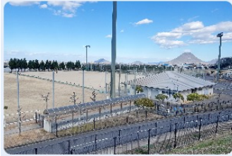
ナイター設備完備