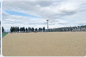
クレイグラウンド