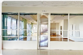
ガラス張りで開放感がある空間