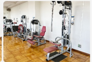
本格的なトレーニング機器