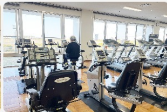
フィットネスバイク/エアロバイク/エクササイズマシン 乗馬フィットネス機器