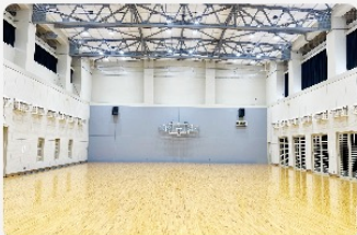
コンパクトサイズのサブアリーナ