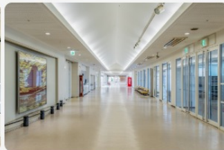
入り口から入って右手奥にあります