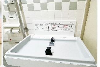
多目的トイレのおむつ交換台