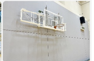
バスケットゴール