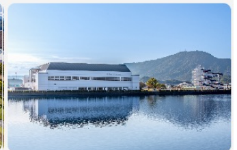
村上池から見た外観