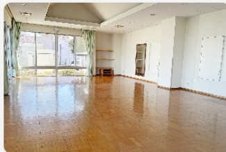
板張りの部屋です

ダンス/ヨガ/ピラティス/チェアヨガ/健康体操・運動/ラジオ体操/卓球(テーブル2台まで)/トレーニング