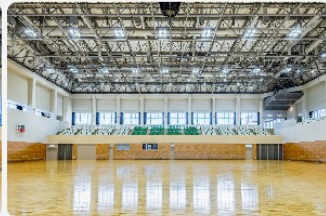
全国区の公式大会も行われています