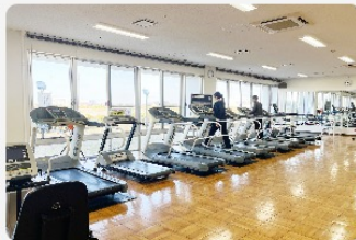
ランニングマシン