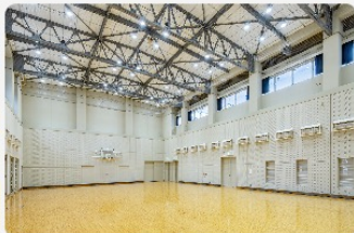
小グループで気軽に楽しめます